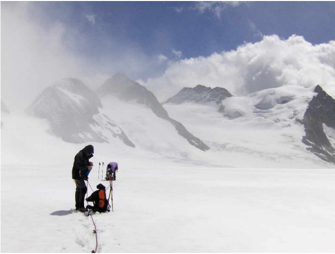
Wege zur Finsteraarhorn Hütte