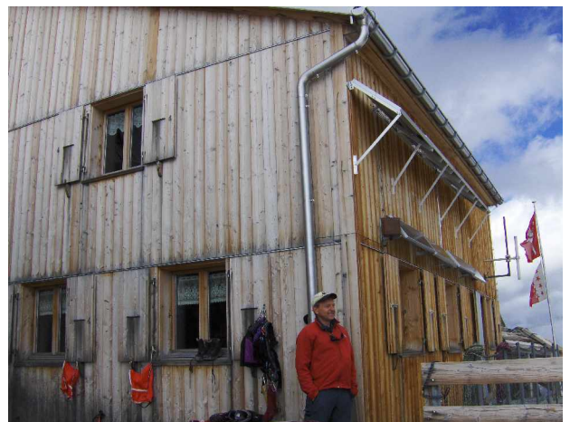
Oberaar Joch Hütte