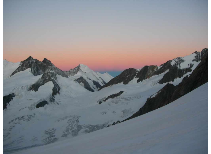
Sonnenaufgang am Finsteraarhorn