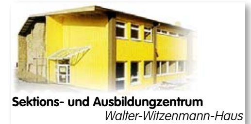
Sektions- und Ausbildungszentrum Walter-Witzenmann-Haus

Witzenmann gemeinsam mit dem Deutschen Alpenverein einen Standort für eine neue Hütte und wurden im Sellrain fündig. Am 5. September 1926 wurde nach zweijähriger Bauzeit die Neue Pforzheimer Hütte von Herrn Dietrich, dem Prior und Dompropst des Stifts Wilten, gesegnet und eingeweiht. Seit dieser Zeit wurde das Berghaus mit sehr viel Engagement der Sektion Pforzheim und der Familie Witzenmann mehrfach ausgebaut und modernisiert. Zuletzt kam 1999 ein großer Anbau hinzu, mit neuen Toiletten, Wasch- und Duschanlagen sowie einer Erweiterung der Küche.