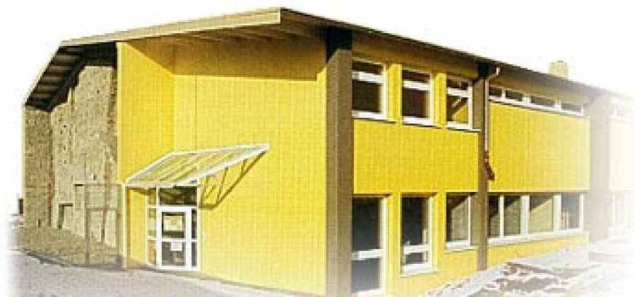
Sektions- und Ausbildungszentrum Walter-Witzenmann-Haus

En 1996 et sur une surface d'escalade de 450 m 2 50 à 70 itinéraires d'escalade dans l' extérieur et interne sont offerts. Hauteur d'escalade à 11 m ; Longueur d'escalade à 17 m ; Difficulté d'escalade après UIAA III - IX