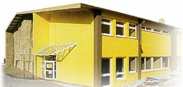
Sektions- und Ausbildungszentrum Walter-Witzenmann-Haus

Zbudowany w 1996 roku, oferuje powierzchnię wspinaczkową wynoszącą 450 m 2 , 50 – 70 dróg wspinaczkowych w obrębie ośrodka i poza nim. Wysokość ściany wspinaczkowej do 11 m, długość dróg wspinaczkowych do 17 m. Stopień trudności według UIAA III-IX.